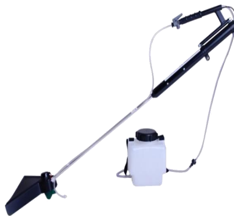
Gambar 2.3 Motor Sprayer