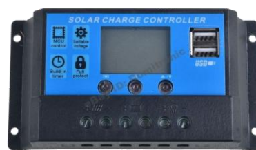
Gambar 2.7 Solar Charge Controller

Seperti yang telah disebutkan di atas solar charge controller yang baik biasanya mempunyai kemampuan mendeteksi kapasitas baterai. Bila baterai sudah penuh terisi 26 maka secara otomatis pengisian arus dari panel surya / solar cell berhenti. Cara deteksi adalah melalui monitor level tegangan baterai. Solar charge controller akan mengisi baterai sampai level tegangan tertentu, kemudian apabila level tegangan drop , maka baterai akan diisi kembali.