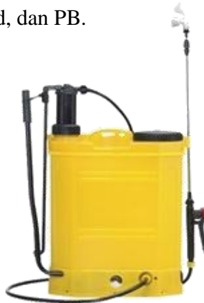
Gambar 2.1 Knapsack Sprayer

Knapsack sprayer atau dikenal dengan alat semprot punggung. Sprayer ini paling umum digunakan oleh petani hampir di semua areal pertanian padi, sayuran, atau diperkebunan. Prinsip kerjanya adalah larutan dikeluarkan dari tangki akibat dari adanya tekanan udara melalui tenaga pompa yang dihasilkan oleh gerakan tangan penyemprot. Pada waktu gagang pompa digerakan, larutan keluar dari tangki menuju tabung udara sehingga tekanan di dalam tabung meningkat. Keadaan ini menyebabkan larutan pestisida dalam tangki dipaksa keluar melalui klep dan selanjutnya diarahkan oleh nozzle bidang sasaran semprot. Tekanan udara yang dihasilkan oleh pompa diusahakan konstant, yaitu sebesar 0,7 – 1,0 kg/cm 2 atau 10-15 Psi. Tekanan sebesar itu diperoleh dengan cara memompa sebanyak 8 kali. Untuk menjaga tekanan tetap stabil, pemompaan dilakukan setiap berjalan 2 langkah pompa harus digerakan sekali naik-turun. Kapasitas tangki knapsack sprayer bervariasi berkisar antara 13, 15, 18, 20 tergantung mereknya. Contoh knapsack sprayer antara lain merek Solo, Hero, CP 5, Matabi, Berthoud, dan PB.