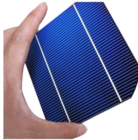
Gambar 2.4 Fotovoltaik

Pembangkit listrik tenaga surya adalah pembangkit listrik yang mengubah energi surya menjadi energi listrik. Pembangkitan listrik bisa dilakukan dengan dua cara, yaitu secara langsung menggunakan fotovoltaik dan secara tidak langsung dengan pemusatan energi surya. Fotovoltaik mengubah secara langsung energi cahaya menjadi listrik menggunakan efek fotoelektrik. Pemusatan energi surya menggunakan sistem lensa atau cermin dikombinasikan dengan sistem pelacak untuk memfokuskan energi matahari ke satu titik untuk menggerakkan mesin kalor.