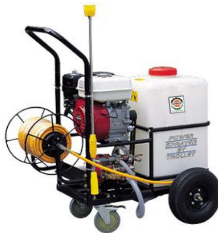
Gambar 2.2 Motor Sprayer