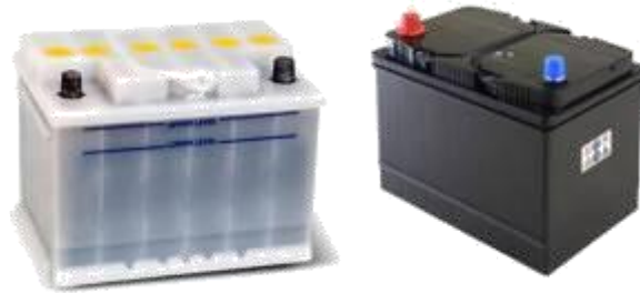
Gambar 2.8 Baterai/Accu

melakukan menghidupkan pompa, baterai berfungsi sebagai penerima arus pertama dari panel.