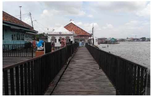
Jalan Menuju Dermaga