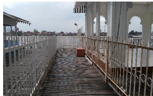
Jalan Menuju Dermaga