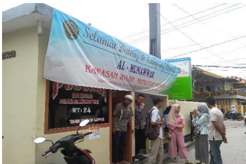
Pos Jaga 1