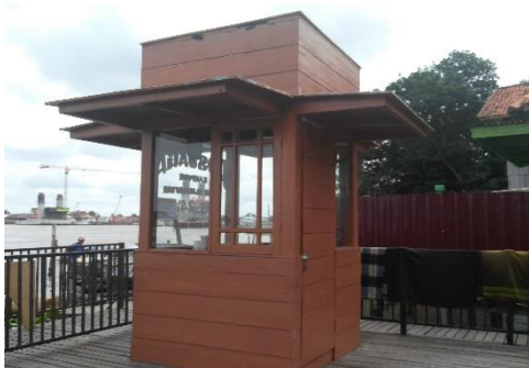
Pos Jaga 2