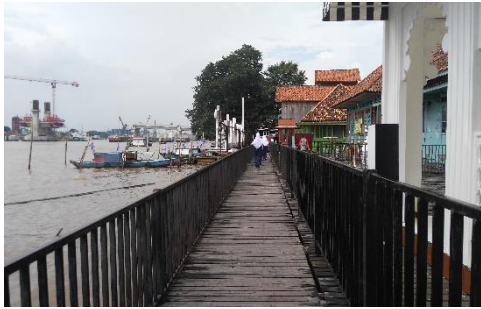
Jalan Menuju Dermaga