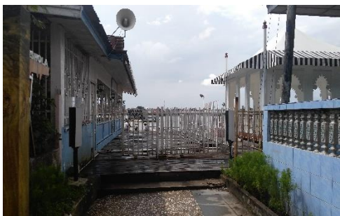
Jalan Menuju Mushola