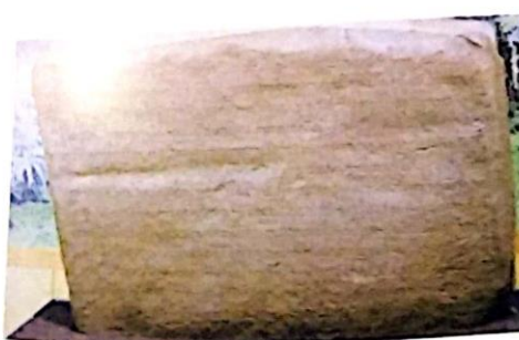
Prasasti Talang Tuo