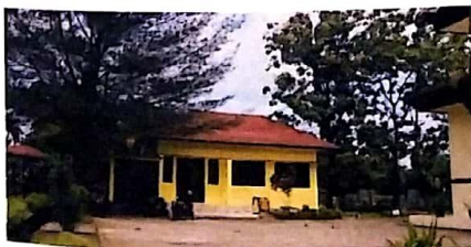
Tourist Information Center