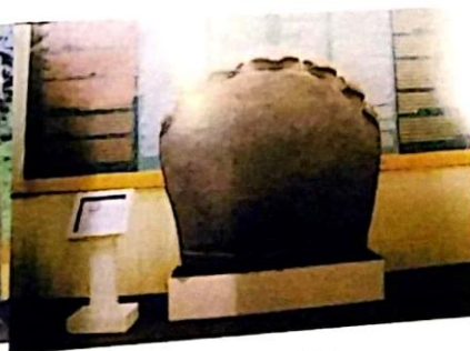
Prasasti Telaga Batu