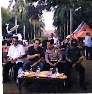
Disukai oleh ulpisaputri dan 103 lainnya taman_kerajaan_sriwijaya Tamu undangan sedang menikmati santapan yang disediakan oleh panitia dan staf acara Launching wahana air dan nobar supermoon serta gerhana bulan di Taman kerajaan Sriwijaya