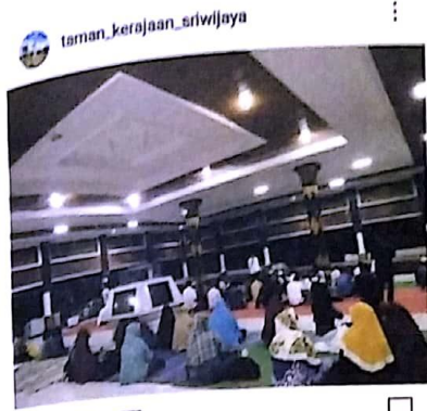
Disukai oleh ulpisaputri dan 110 lainnya taman_kerajaan_sriwijaya Jama'ah sholat gerhana di Pendopo Taman Wisata kerajaan Sriwijaya