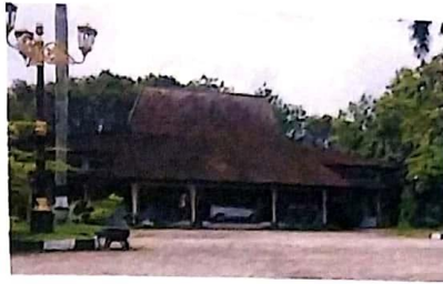
Ruang Publik Tapal Kuda