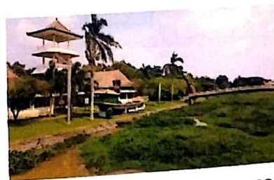
Menara dan Replika Kapal Ceng HO