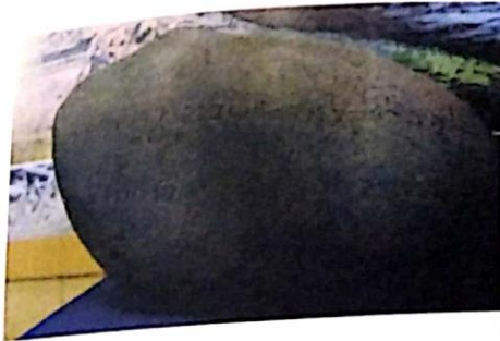
Prasasti Kedukan Bukit