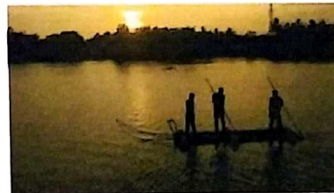
Disukai oleh ulpisaputri dan 108 lainnya taman_kerajaan_sriwijaya Haloooo sahabat Taman Wisata Kerajaan Sriwijaya 📸📸📸 Mimin akan mengumumkan Pemenang Foto kontes pada saat acara Nonton Bareng Super blue blood moon di Taman Wisata Kerajaan Sriwijaya pada tanggal 31 Januari 2018 kmren.

Dan yang menjadi juaranya adalah. ✓ Juara pertama : @suzannita ✓ Juara kedua : @mayangaru ✓ Juara ketiga : @ahmadredhonugraha