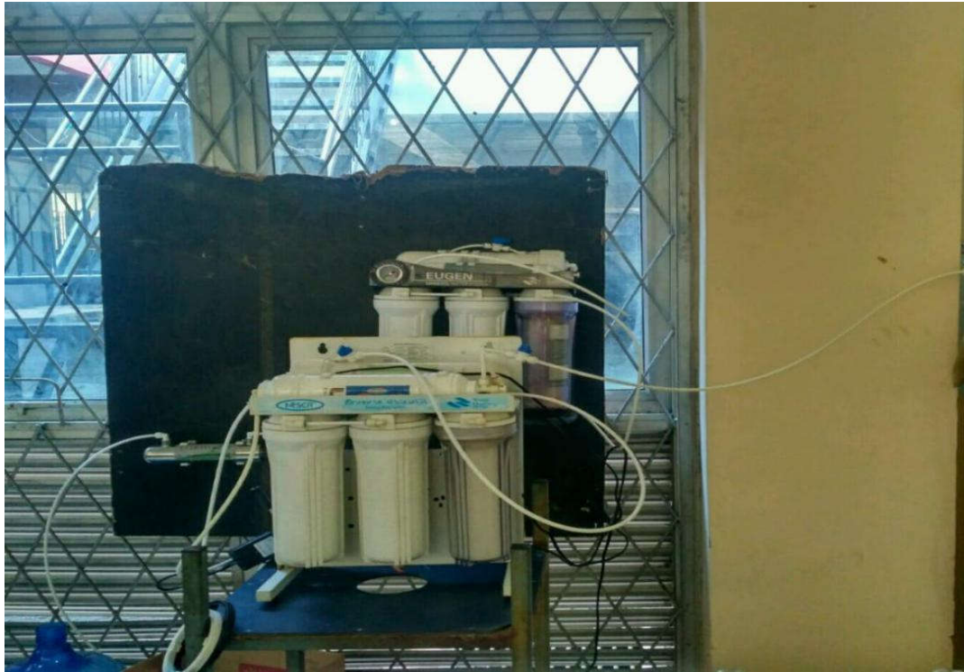
Seperangkat Alat Produksi Air Minum dengan Menggunakan Reverse Osmosis