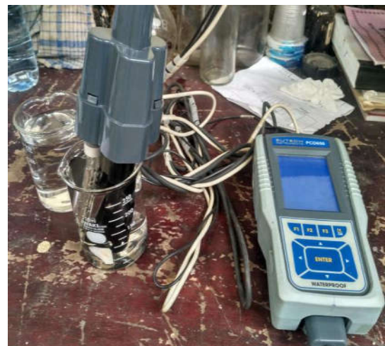
Pengukuran Kadar Oksigen