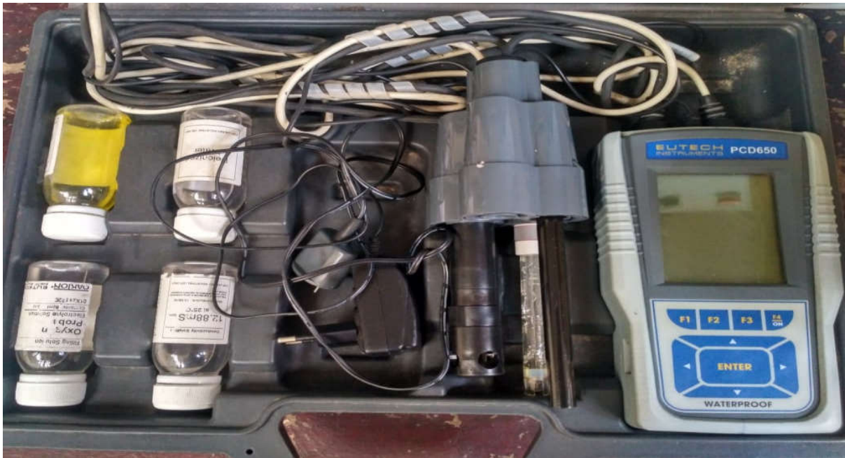
Alat Waterproof (Eutech Instrumen PCD 650)