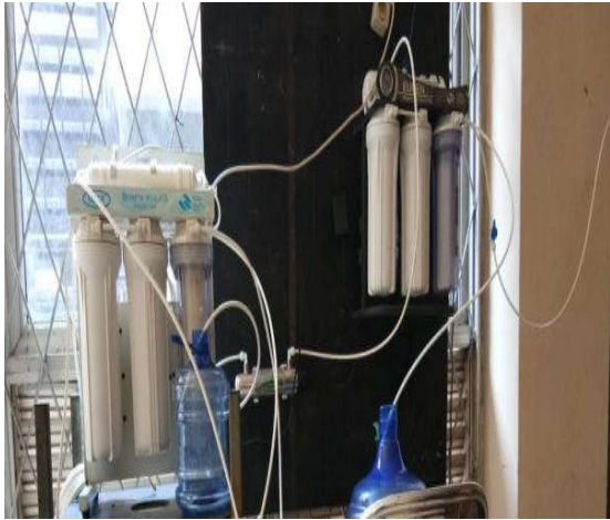
Proses Pengolahan Air Minum Kemasan dengan Reverse Osmosis