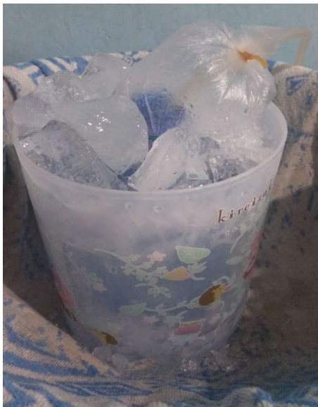
Menjaga suhu dengan batu es