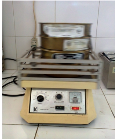
Gambar 16. Proses Mengayak Abu Terbang Batubara