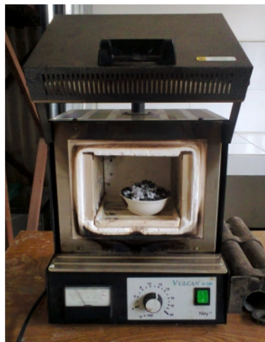
Gambar 21. Proses Peleburan Abu Terbang Batubara + NaOH di dalam Furnace