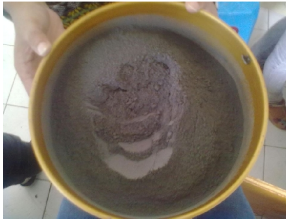
Gambar 17. Abu Terbang Batubara Setelah Lolos Ayakan 20 mesh