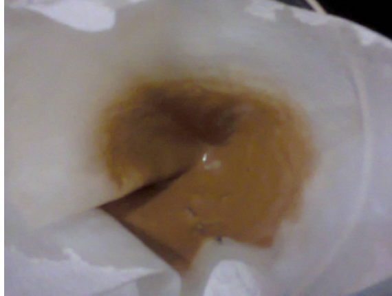
Gambar 31. Cake / Produk yang Didapat