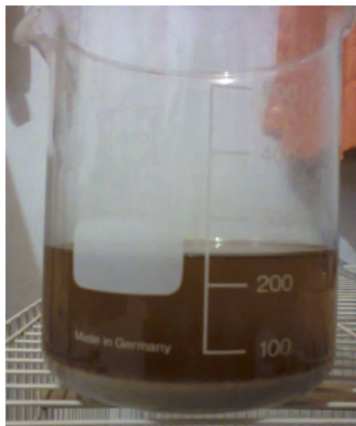
Gambar 29. Hasil Sintesis