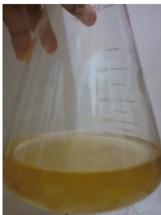
Gambar 24. Natrium Silikat