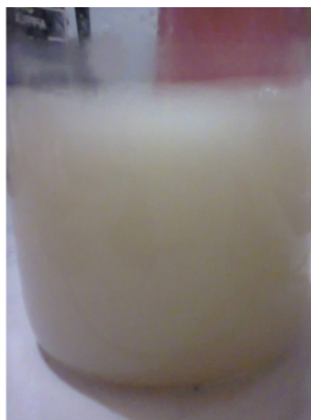
Gambar 27. Hasil Pencampuran Natrium Silikat + Natrium Aluminat