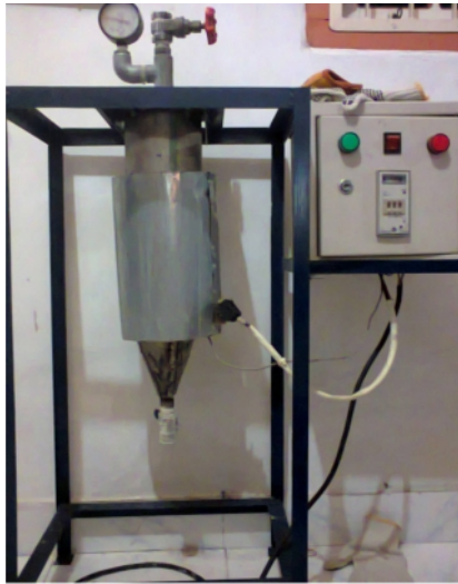
Gambar 28. Autoclave