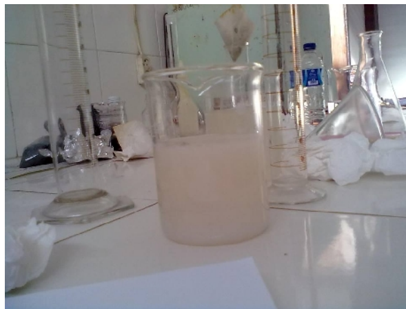
Gambar 26. Natrium Aluminat