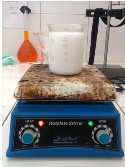
Gambar 25. Pembuatan Natrium Aluminat