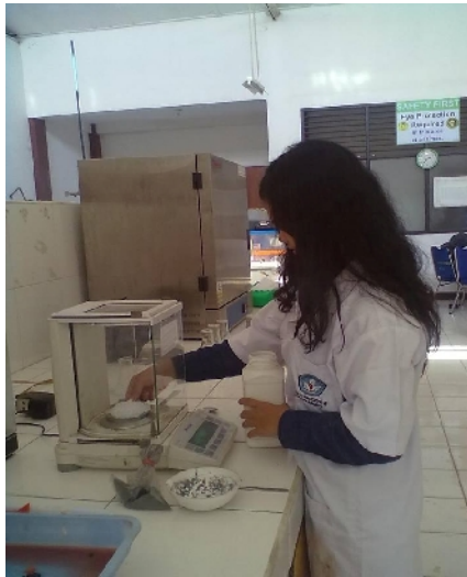
Gambar 19. Proses Penimbangan NaOH