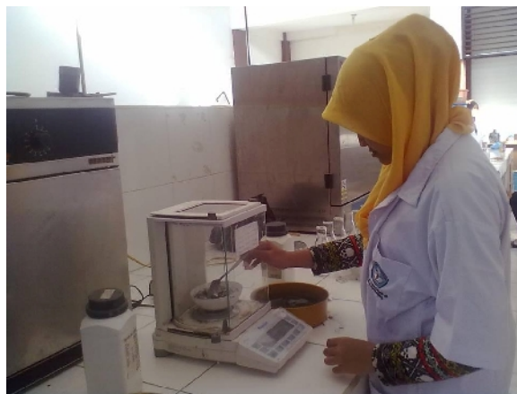
Gambar 18. Proses Penimbangan Abu Terbang Batubara