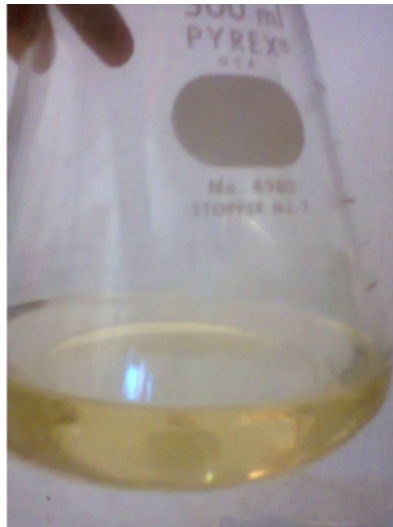
Gambar 32. Filtrat yang Didapat