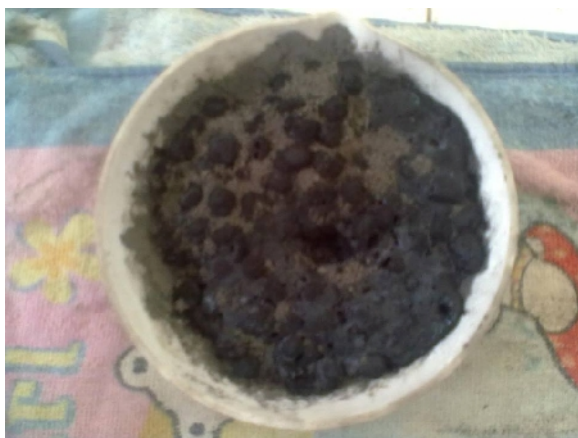
Gambar 22. Hasil Leburan Selama \pm 15 Menit