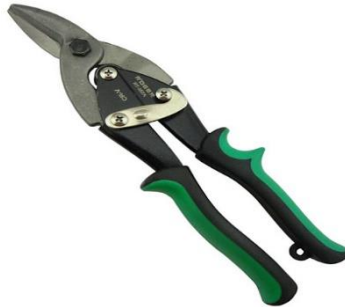
Gambar 2.4 Gunting Pelat

bertujuan agar konstruksinya kuat dan juga gunting ini sering digunakan untuk memotong benda-benda yang permukaannya keras.