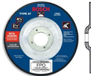
Gambar 2.7 Batu Gerinda Asah