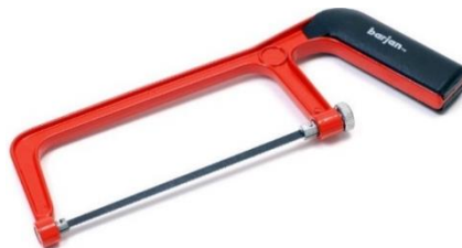
Gambar 2.3 Gergaji Besi

Prinsip kerja dari gergaji adalah Langkah pemotongan kearah depan sedangkan Langkah mundur mata gergaji tidak melakukan pemotongan. Prinsip kerja tersebut sama dengan prinsip kerja mengikir pekerjaan pemotongan dilakukan oleh dua daun mata gergaji yang mempunyai gigi-gigi pemotong.