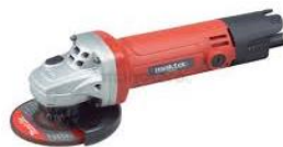
Gambar 2.1 Gerinda

Pemotongan dengan gerinda potong ini menggunakan batu gerinda sebagai alat potong. Proses kerja pemotongan dilakukan dengan menjepit material pada ragam mesin gerinda. Selanjutnya batu gerinda dengan putaran tinggi digesekan ke material. Kapasitas pemotongan yang dapat dilakukan pada mesin gerinda ini hanya terbatas pada pemotongan profil-profil. Profil-profil ini diantaranya pipa, pelat strip, besi siku, pipa stalbush dan sebagainya.