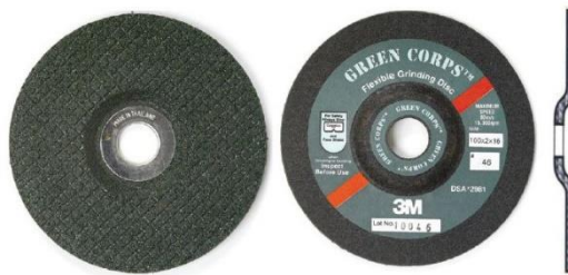
Gambar 2.8 Batu Gerinda Fleksibel

Batu gerinda fleksibel, atau biasa disebut dengan “ Flexible disc ” secara fisik memiliki bentuk seperti batu gerinda asah, namun lebih tipis dengan bagian permukaan memiliki pola atau pattern. Batu gerinda jenis ini biasanya digunakan untuk mengikis permukaan logam khusus pada area-area yang terbatas/sempit. Selain itu batu gerinda fleksibel ini dapat digunakan untuk memotong logam, namun kelemahan yang dihasilkan dari fungsi ini, adalah area yang terpotong akan lebih banyak/lebar daripada dengan menggunakan batu gerinda potong.