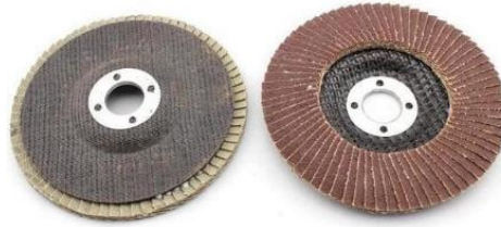
Gambar 2.9 Ampelas gerinda susun