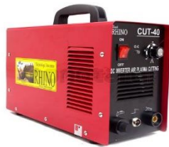
Gambar 2.2 Las Plasma Cutting

Plasma cutting adalah proses yang digunakan untuk memotong baja atau logam. Dalam proses pemotongan pelat, gas yang terkandung dalam udara yang dikompresi (78% nitrogen, 21% oksigen, 1% argon) ditiup dengan kecepatan tinggi keluar dari nozzel, pada waktu yang sama busur listrik terbentuk melalui gas dari nozzel ke permukaan yang dipotong, kemudian mengubah sebagian dari udara menjadi plasma. Plasma memiliki panas yang cukup untuk melelehkan logam yang dipotong dan mampu bergerak dengan cepat untuk mencairkan logam dari bagian yang dipotong.