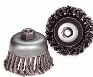
Gambar 2.10 Sikat Gerinda

Berdasarkan jenisnya produk sikat gerinda ( Steel Wheel Brush ) diciptakan berbeda menjadi 2 bentuk, yaitu rata ( Wheel Wire Brush ), dan berbentuk mangkuk ( Cup Wire Brush ). Fungsi dari sikat gerinda adalah untuk membersihkan bagian-bagian permukaan logam dari adanya kotoran, seperti karat, kerak, serta akibat proses oksidasi pada permukaan logam.