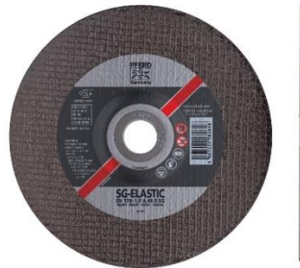
Gambar 2.9 Batu Gerinda Potong

stainless steel, dengan tentunya menyesuaikan spesifikasi pada produk tersebut.