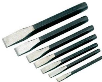
Gambar 2.5 Pahat Potong

Pahat potong digunakan bagian dalam dari sisi pelat, sebab pemotongan bagian dalam pelat ini sulit dilakukan dengan gunting. Prinsip kerjanya pemotongan pelat dengan pahat ini dilakukan diatas landasan pada ragam-ragam meja. Teknik pemotongan ini dapat dilihat seperti pada gambar dibawah. Garis pemotongan diletakkan sejajar dengan catok ragam dan pahat dimiringkan 30^{\circ} terhadap arah pemotongan.