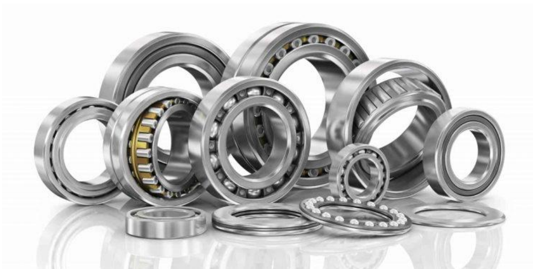
Gambar 2.9 Bearing

1. Jika berdasarkan gesekan yang terjadi pada bearing , maka bearing terbagi menjadi dua jenis yakni: