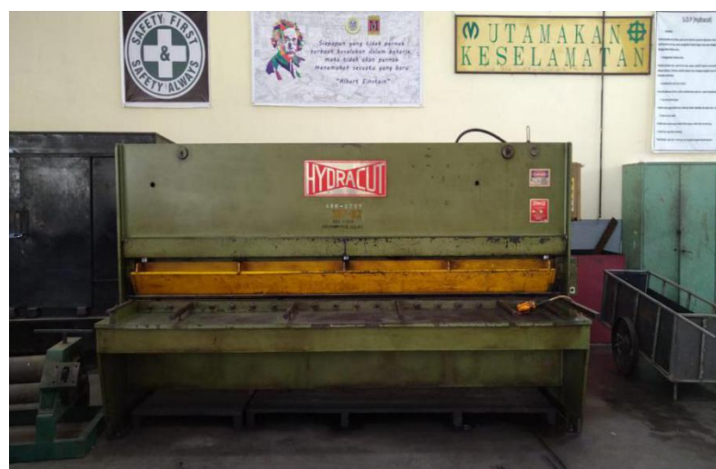
Gambar 2.4 Mesin Gunting Hidrolik

Mesin potong hidrolik menggunakan tenaga power supply tenaga hidrolik. Tenaga hidrolik yang dihasilkan untuk memotong adalah pompa hidrolik yang digerakkan oleh motor listrik. Mesin gunting hidrolik ini dilengkapi dengan program pada panel box control hidrolik. Dengan program hidrolik ini pelayanan untuk operasional mesin potong menjadi lebih sederhana. Kemampuan menggunting atau memotong plat dengan mesin hidrolik ini sampai mencapai ketebalan pelat 20 mm. Prinsip kerja mesin hidraulik ini sama dengan mesin gullotine umumnya. Hanya penekan yang digunakan pada mesin ini menggunakan actuator kerja ganda ( double acting ) dengan silinder sebanyak dua buah.