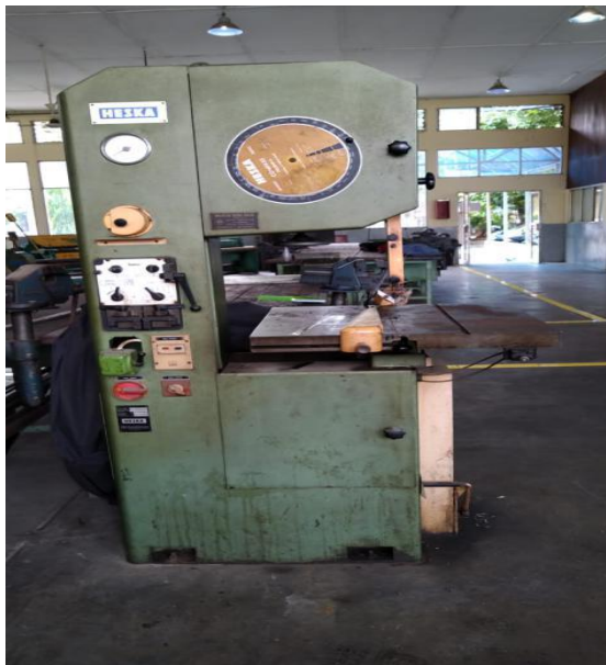
Gambar 2.1 Mesin Pemotong Pelat

Mesin pemotong pelat atau biasa disebut shearing machine adalah suatu alat pemotong pelat yang bekerja dengan prinsip kerja memotong pelat dengan prinsip menggunting. Mata pisau pada mesin tersebut miring yang bertujuan agar pada saat pemotongan beban tidak secara langsung menggeser permukaan yang akan dipotong.