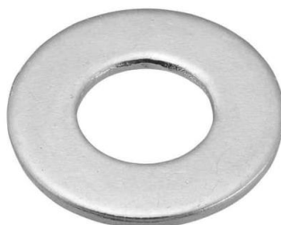
Gambar 2.12 Ring

Lainnya adalah ring per. Ring ini dikenali dari bentuknya yang terputus. Ring ini berfungsi lebih detail lagi. Karena bentuknya mirip per, ia berguna untuk mendorong baut atau mur yang berfungsi sebagai pengunci. Dengan dorongan ring per, baut atau mur akan semakin mengunci.