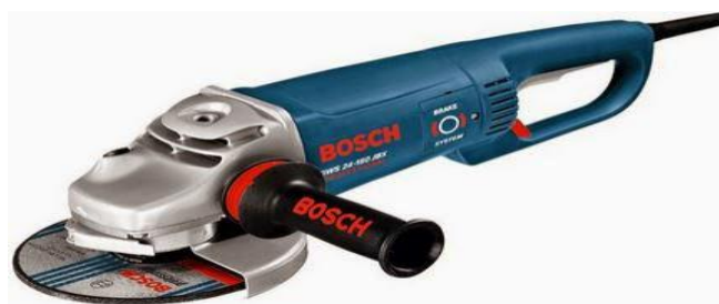
Gambar 2.7 Mesin Gerinda Tangan

Mesin gerinda tangan merupakan mesin yang berfungsi untuk menggerinda benda kerja. Menggerinda dapat bertujuan untuk mengasah benda kerja seperti pisau dan pahat, atau dapat juga bertujuan untuk membentuk benda kerja seperti merapikan hasil pemotongan, merapikan hasil las, membentuk lengkungan pada benda kerja yang bersudut, menyiapkan permukaan benda kerja untuk dilas, dan lain-lain. Mesin Gerinda didesain untuk dapat menghasilkan kecepatan sekitar 11000–15000 rpm. Dengan kecepatan tersebut batu gerinda, yang merupakan komposisi aluminium oksida dengan kekasaran serta kekerasan yang sesuai, dapat menggerus permukaan logam sehingga menghasilkan bentuk yang diinginkan. Dengan kecepatan tersebut juga, mesin gerinda dapat digunakan untuk memotong benda logam dengan menggunakan batu gerinda yang dikhususkan untuk memotong.