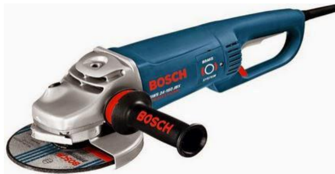
Gambar 2.5 Mesin Gerinda Tangan