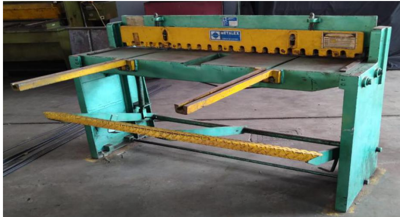
Gambar 2.3 Mesin Gullotine Manual