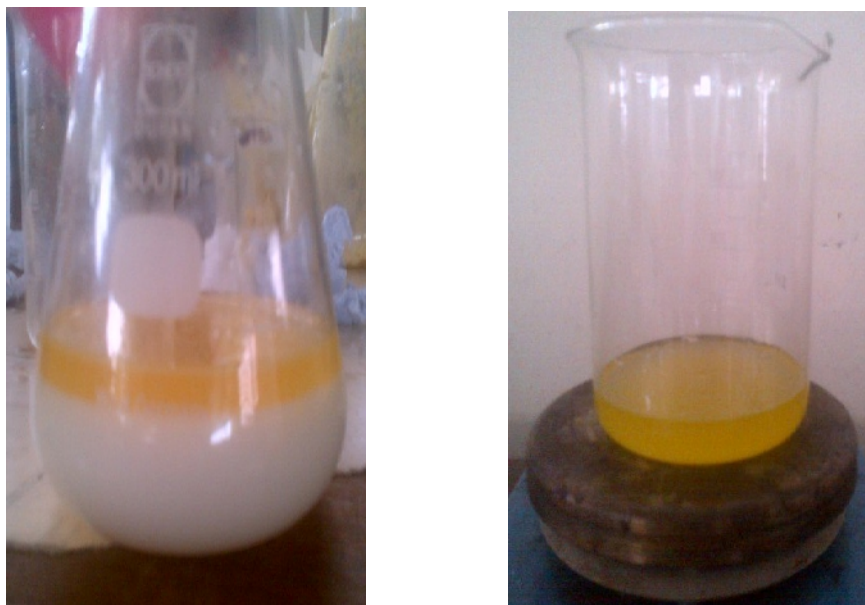
Gambar 15. Proses pencucian dan evaporasi biodiesel