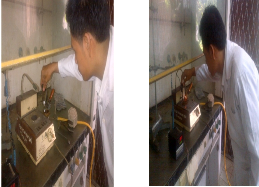
Gambar 21. Analisis titik nyala biodiesel