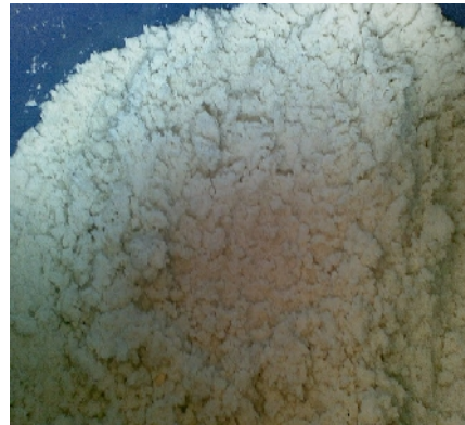
Gambar 10. Limbah Ampas Kedelai sebelum dan sesudah dikurangi kadar airnya