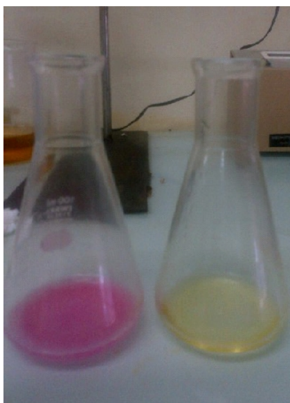
Gambar 19. Analisis bilangan asam biodiesel