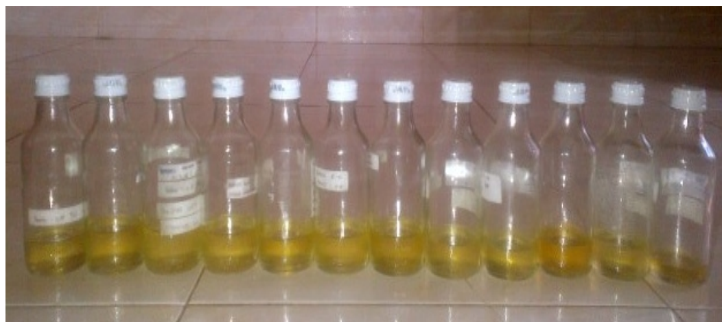
Gambar 16. Produk biodiesel