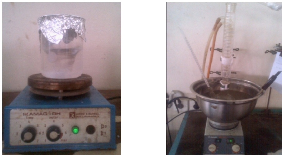
Gambar 12. Melarutkan katalis kedalam metanol dan proses transesterifikasi in situ