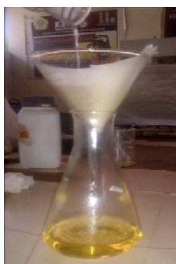
Gambar 13. Proses penyaringan