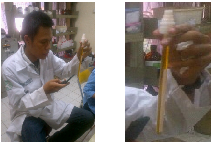
Gambar 18. Analisis viskositas biodiesel