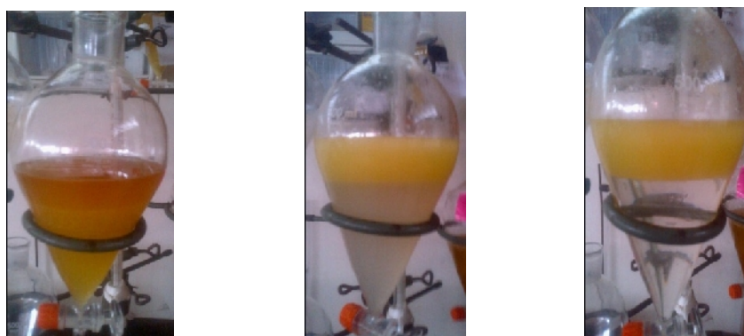
Gambar 14. Proses pemisah menggunakan corong pisah