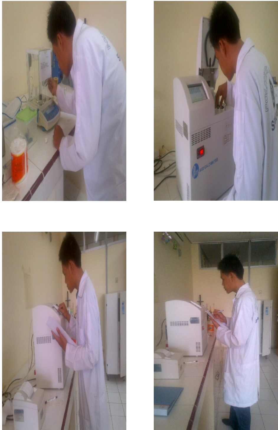
Gambar 20. Analisis nilai kalor biodiesel