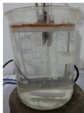
Sampel Air Gambut setelah di Elektrokoagulasi selama 60 menit