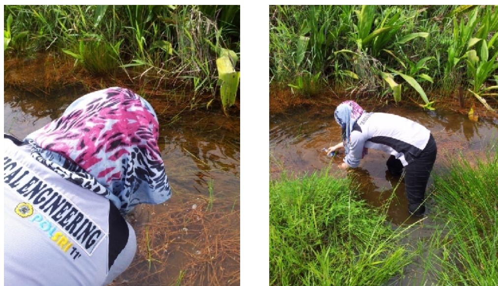
Gambar 20. Pengambilan Sampel Air Gambut