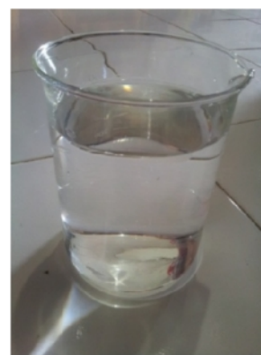
Hasil Air Gambut setelah Pengolahan dengan Elektrokoagulasi selama 120 menit