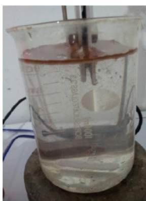
Sampel Air Gambut setelah di Elektrokoagulasi selama 120 menit