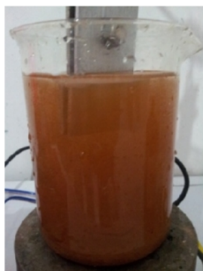
Sampel Air Gambut sebelum di Elektrokoagulasi