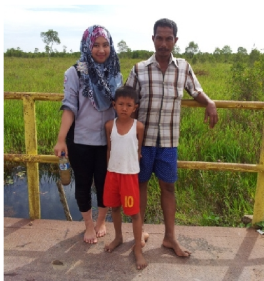
Gambar 18. Lokasi Pengambilan Sampel