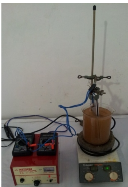
Gambar 21. Rangkaian Alat Elektrokoagulasi