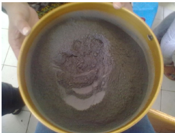
Gambar 17. Abu Terbang Batubara Setelah Lolos Ayakan 20 mesh