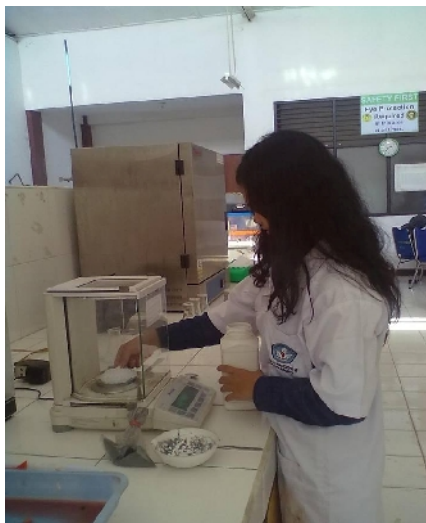
Gambar 19. Proses Penimbangan NaOH