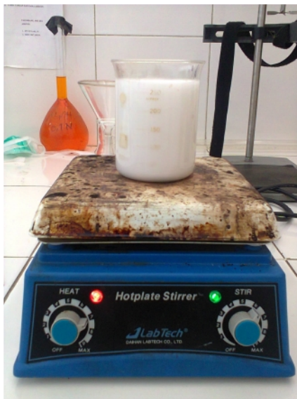
Gambar 25. Pembuatan Natrium Aluminat