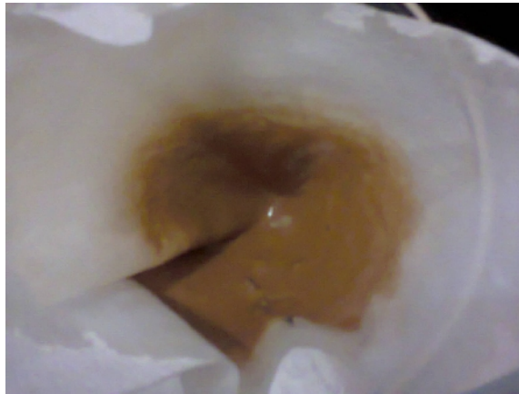
Gambar 31. Cake / Produk yang Didapat