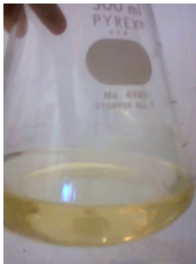
Gambar 32. Filtrat yang Didapat