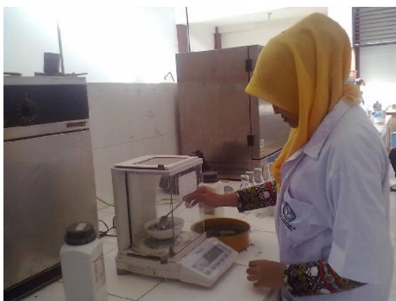
Gambar 18. Proses Penimbangan Abu Terbang Batubara