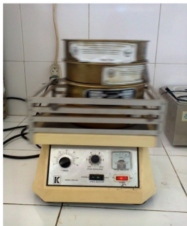
Gambar 16. Proses Mengayak Abu Terbang Batubara