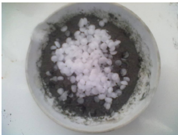
Gambar 20. Hasil Pencampuran Abu Terbang Batubara + NaOH