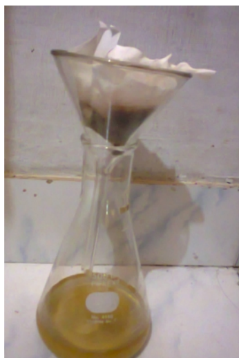
Gambar 30. Proses Penyaringan Produk