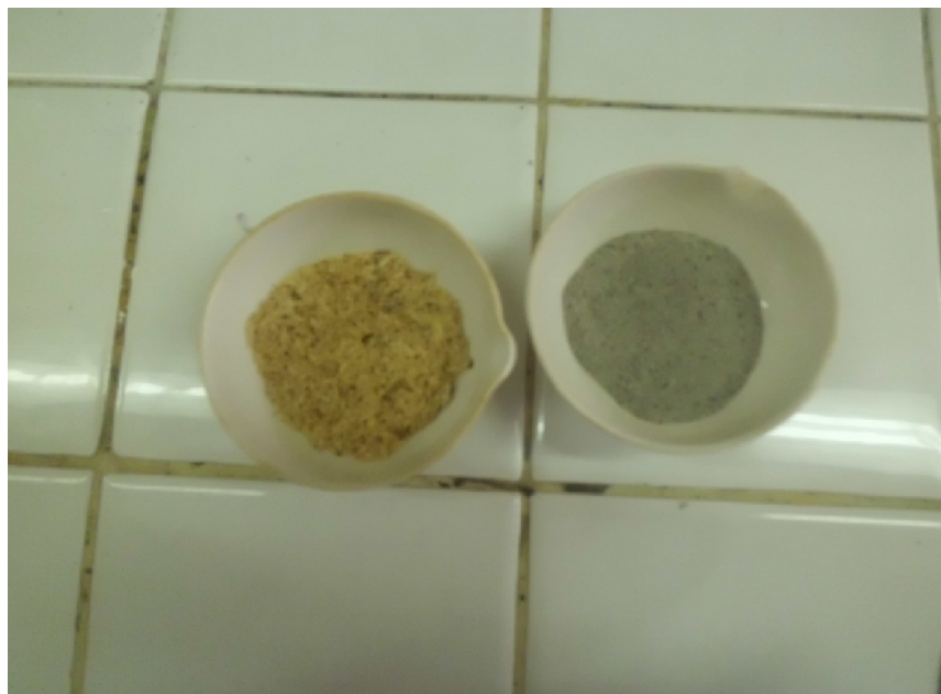
Gambar Lampiran 3.1. Sekam Padi Sebelum dan Sesudah Menjadi Abu