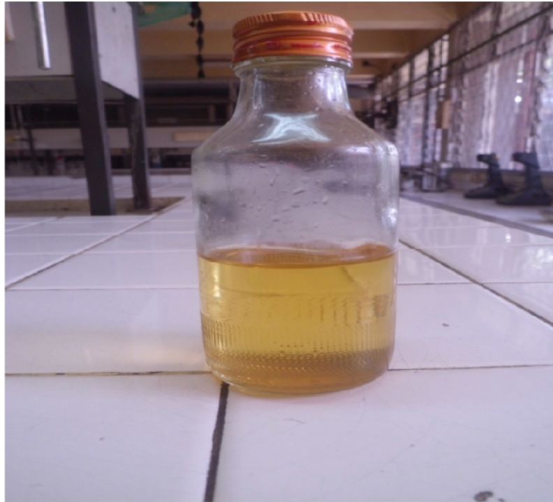
Gambar Lampiran 3.4. Minyak Jelantah Setelah di Adsorbsi