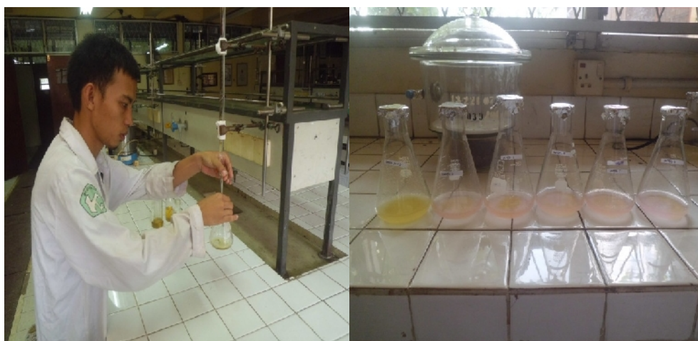
Gambar Lampiran 3.8. Analisa Asam lemak Bebas