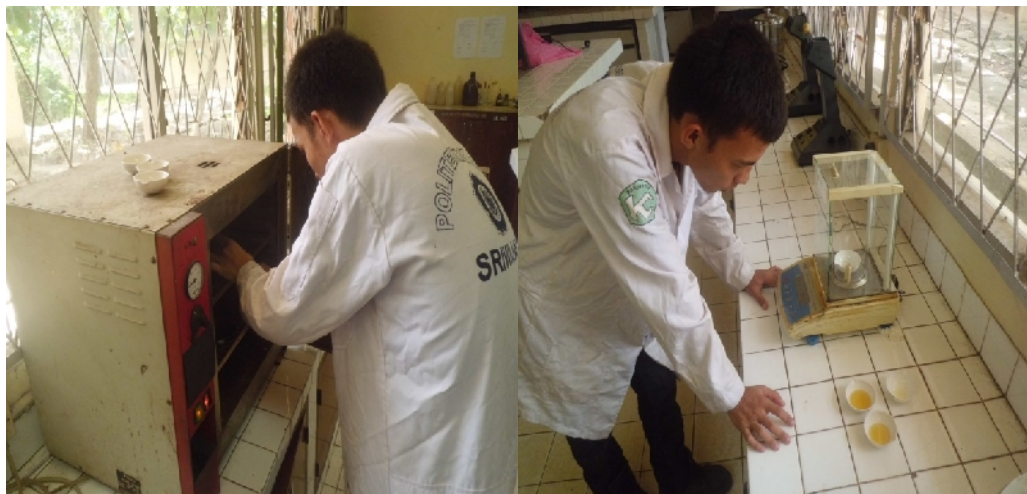
Gambar Lampiran 3.9. Analisa Kadar Air