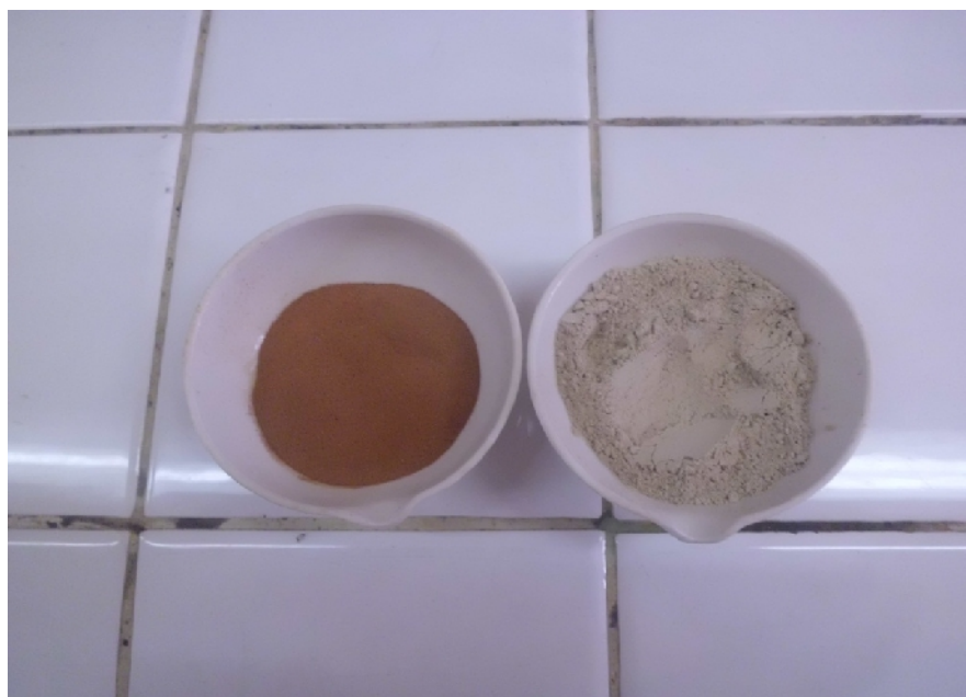
Gambar Lampiran 3.2. Bentonit Sebelum dan Sesudah di Aktivasi