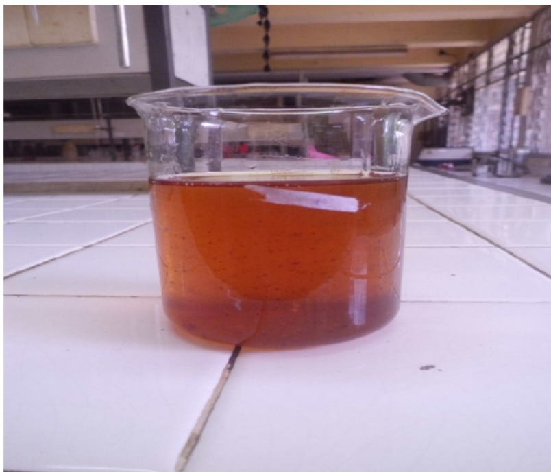
Gambar Lampiran 3.3. Minyak Jelantah Sebelum di Adsorbsi