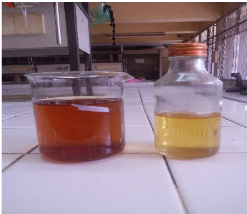
Gambar Lampiran 3.5. Perbandingan Minyak Jelantah Sebelum dan Sesudah di Adsorpsi