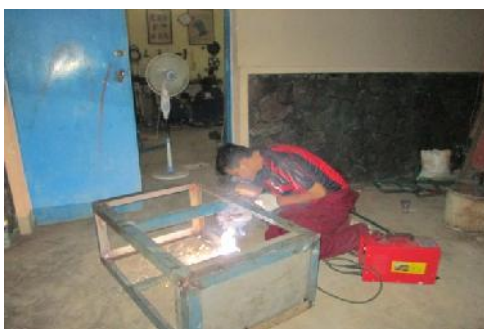
Gambar 17. Pengelasan Besi Rangka