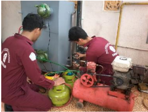
Gambar 31. Pemasangan Tabung Gas