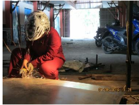
Gambar 14. Pemotongan Pelat