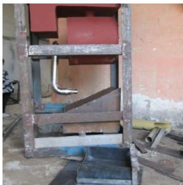
Gambar 23. Pemasangan Cerobong