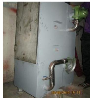
Gambar 30. Pemasangan Pintu