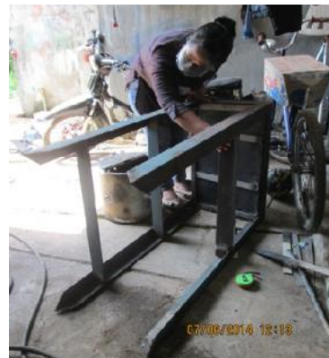
Gambar 16. Perakitan Besi Rangka