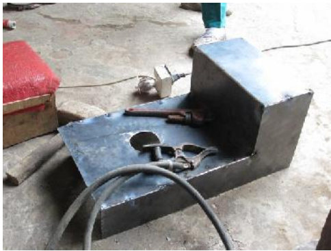
Gambar 21. Penampung Flue Gas Primary Chamber