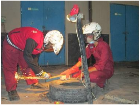
Gambar 13. Pemotongan Besi Rangka`