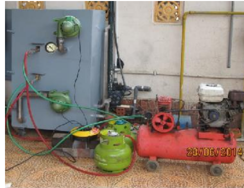
Gambar 32. Unit Insinerator