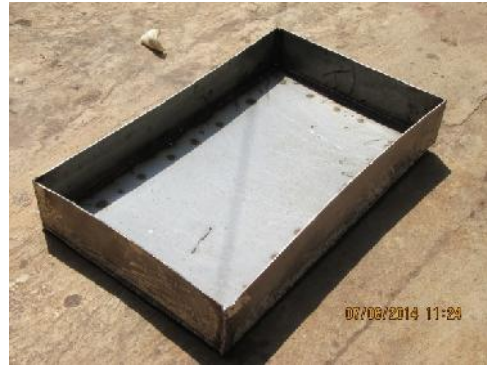
Gambar 20. Penampung Absorben