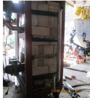
Gambar 26. Pemasangan Batu Tahan Api