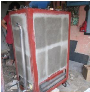
Gambar 27. Penyelesaian Dinding