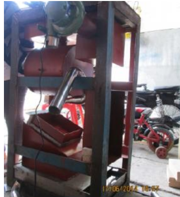
Gambar 25. Perangkaian Secondary Chamber