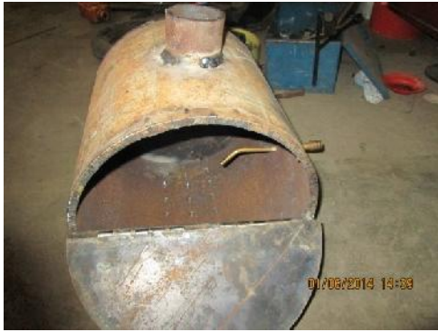
Gambar 19. Primary Chamber