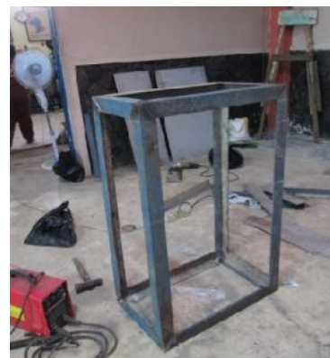
Gambar 18. Rangkaian Besi Rangka