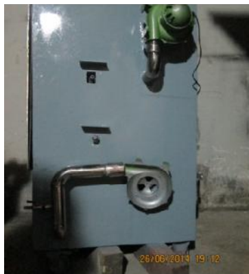
Gambar 29. Pemasangan Blower