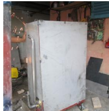
Gambar 28. Pemasangan Dinding Plat