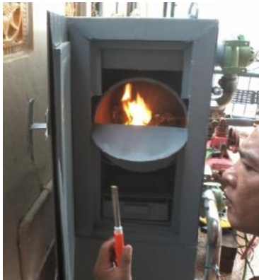
Gambar 33. Pembakaran pada Primary Chamber