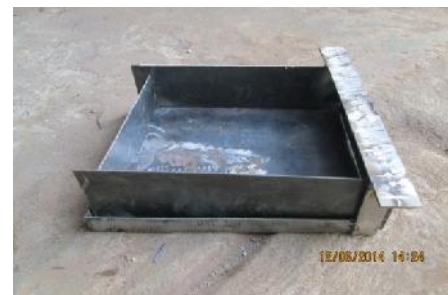
Gambar 24. Penampung Abu