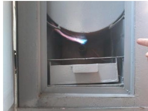
Gambar 34. Pembakaran pada Secondary Chamber