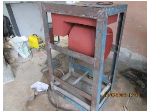
Gambar 22. Pemasangan Primary Chamber