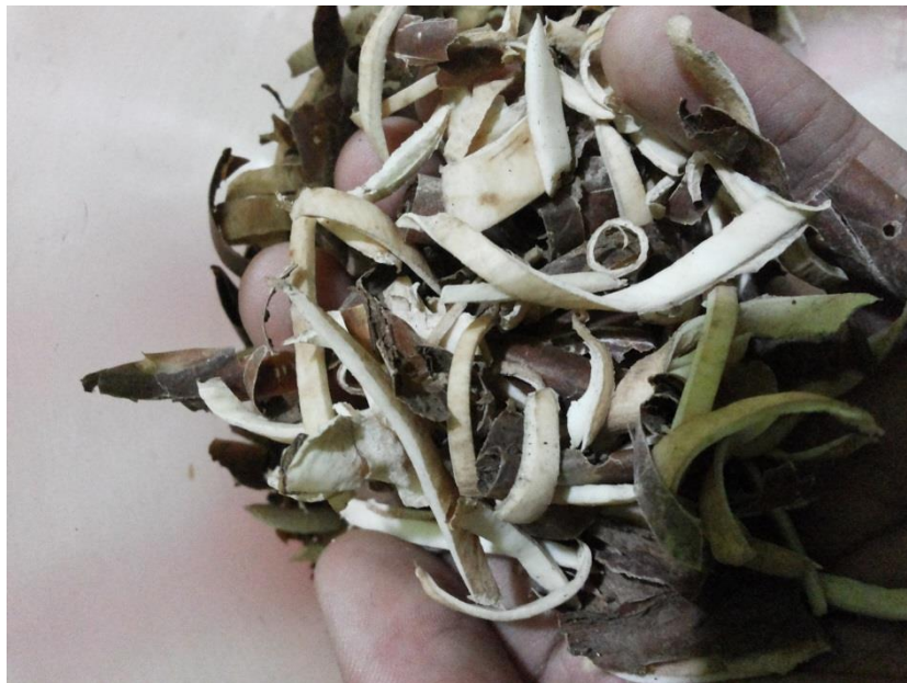
Gambar 8. Kulit Ubi Kayu