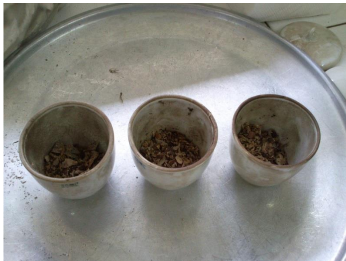
Gambar 10. Ubi gadung setelah proses karbonisasi