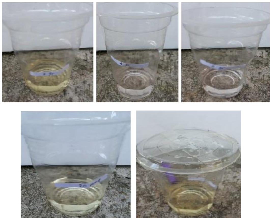
Gambar 16. Hasil Adsorpsi setelah penyaringan