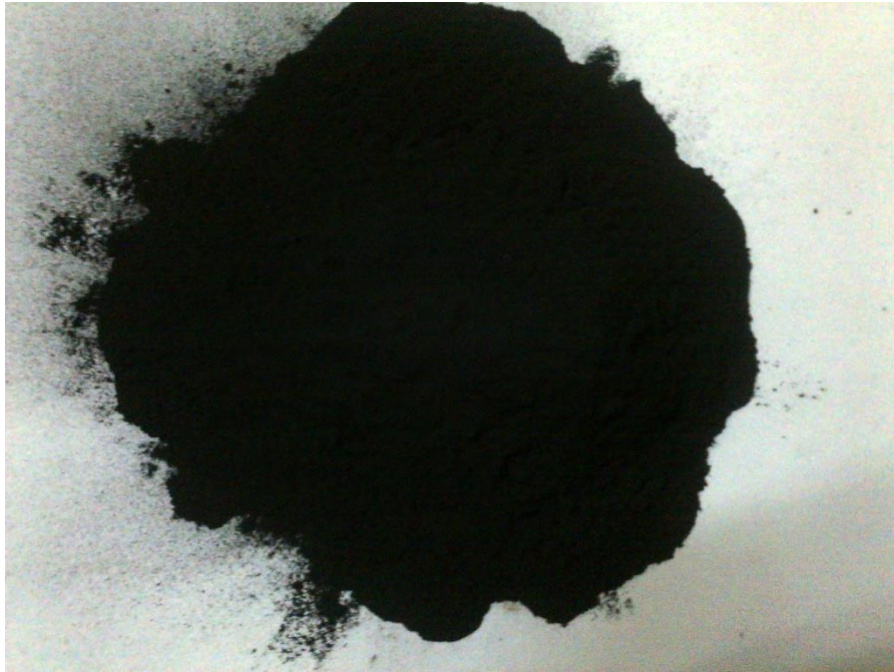
Gambar 13. Karbon aktif ukuran -170 mesh