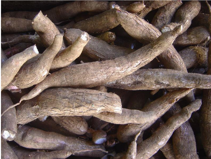
Gambar 7. Ubi kayu