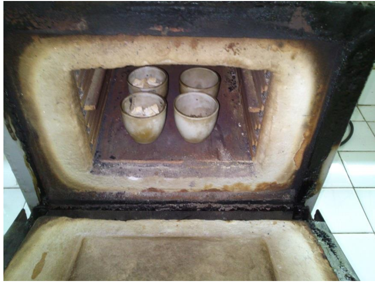
Gambar 9. Proses karbonisasi kulit ubi kayu di dalam furnace