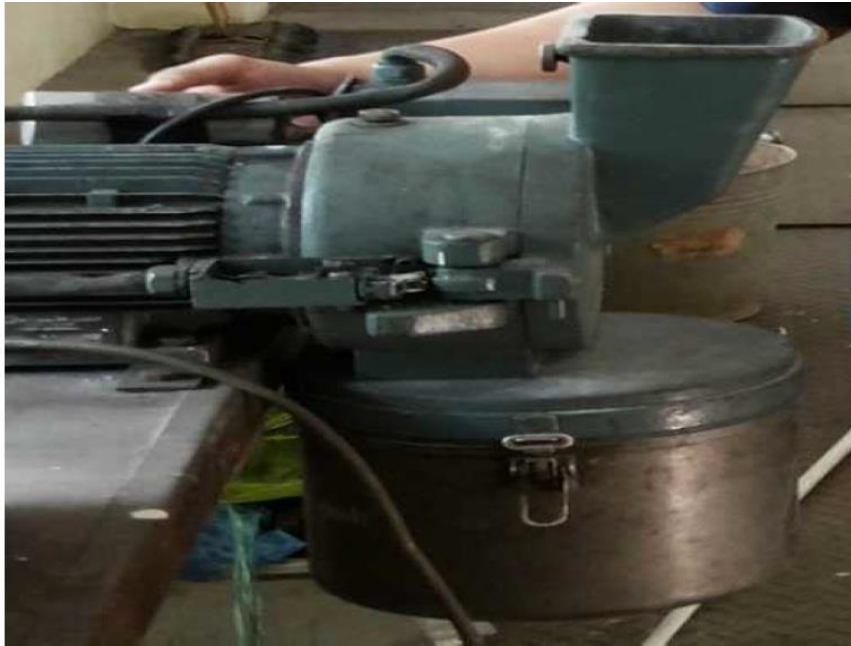
Gambar 11. Memperkecil ukuran karbon aktif dengan grinder