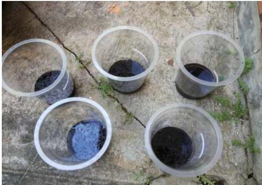
Gambar 15. Proses pengontakan karbon aktif dengan limbah