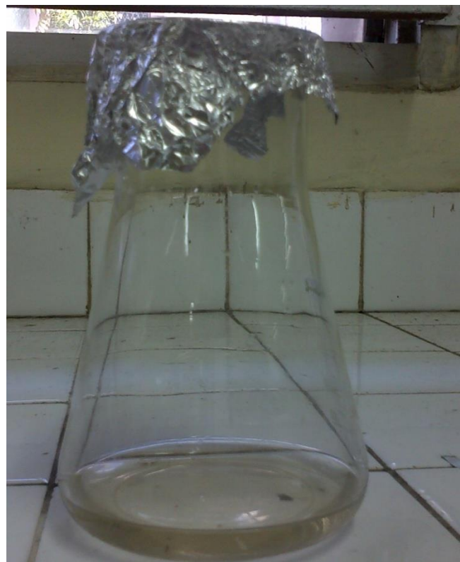
Gambar 18. Hasil pengontakkan limbah cair laboratorium dengan variasi berat adsorben dan konsentrasi aktivator