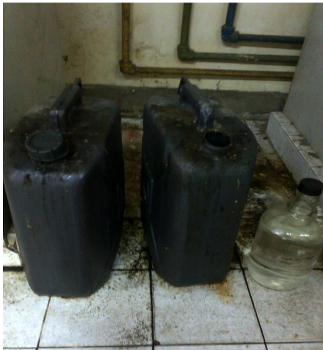
Gambar 14. Limbah cair laboratorium