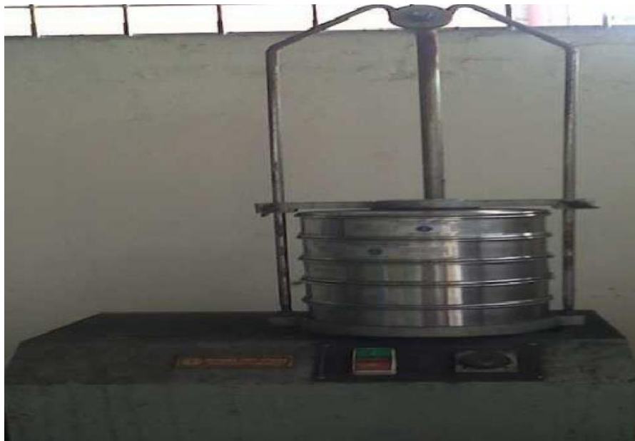
Gambar 12. Sieve shaker