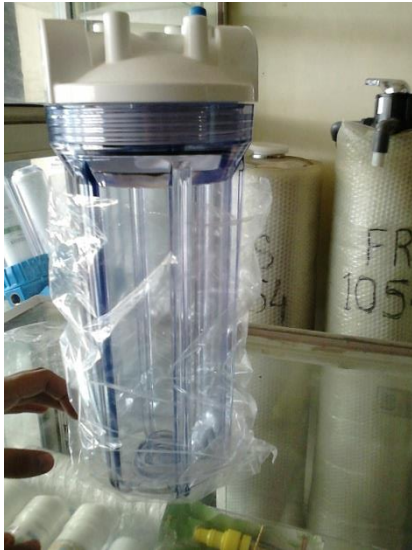
Gambar 21. Reaktor Elektrolisis