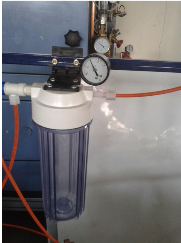
Gambar 30. Tabung Penampung Gas Hasil Elektrolisis