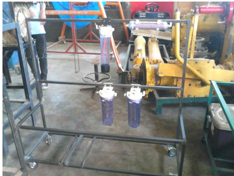
Gambar 25. Pemasangan Komponen Alat ( Bubbler , Reaktor dan Absorber)