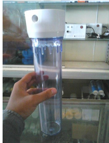
Gambar 22. Tabung Bubbler