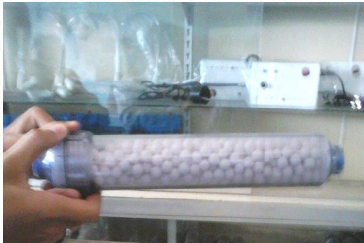
Gambar 23. Tabung Absorber