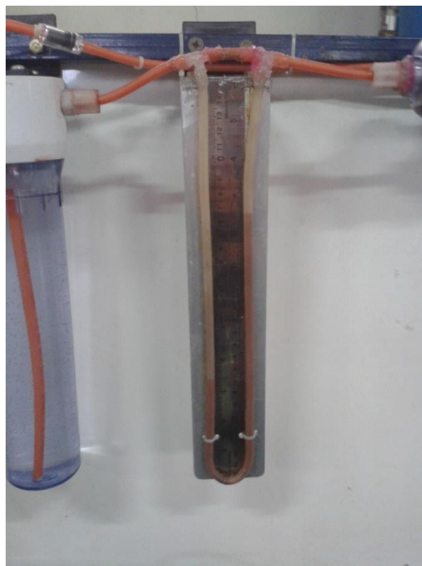
Gambar 29. Laju Alir Gas Hasil Elektrolisis Melalui Tabung U