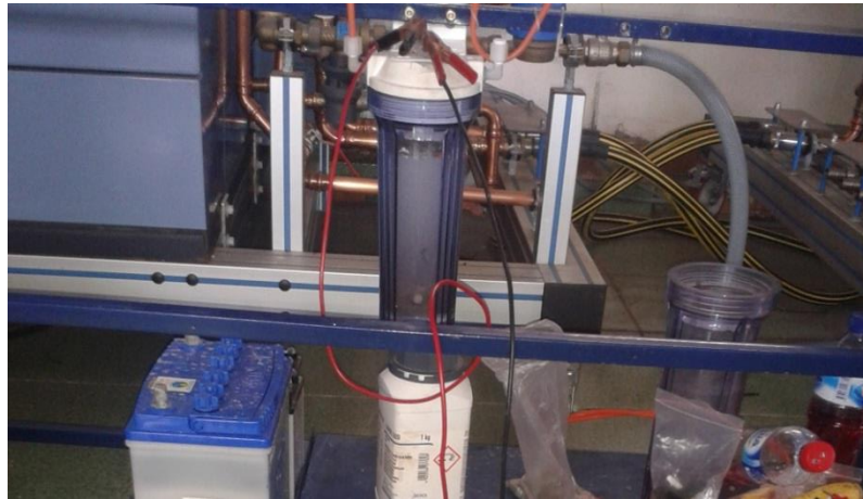
Gambar 28. Proses Elektrolisis Air dengan Elektrolit Natrium Hidroksida