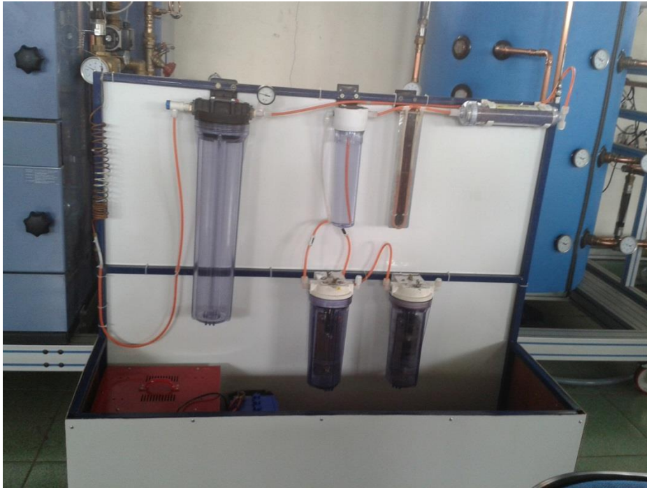
Gambar 26. Finishing Pembuatan Alat Hydrogen Fuel Generator