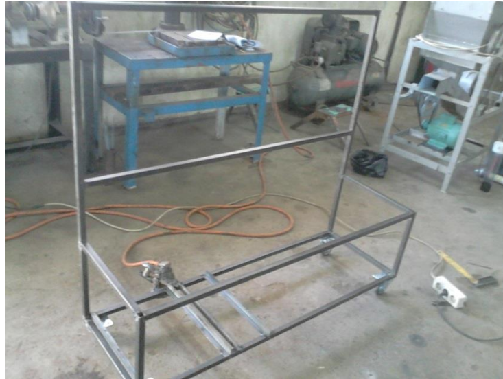
Gambar 24. Pembuatan Kerangka Alat Hydrogen Fuel Generator