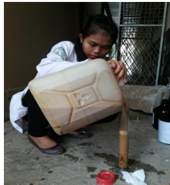
Gambar 5. Penambahan POME ke dalam Bibit