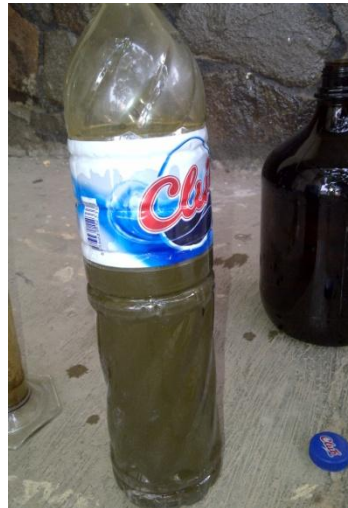
(b) Cairan Kotoran Sapi