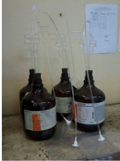
Gambar 6. Proses Fermentasi Gas Metan