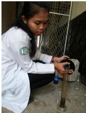
(a) Pengambilan sampel untuk Analisa COD