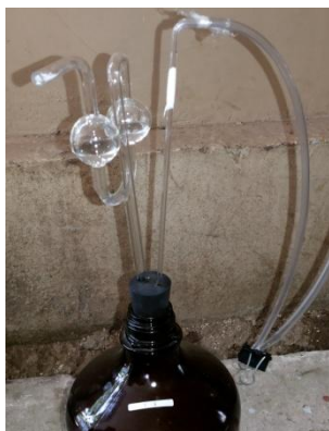
(a) Botol Fermentasi