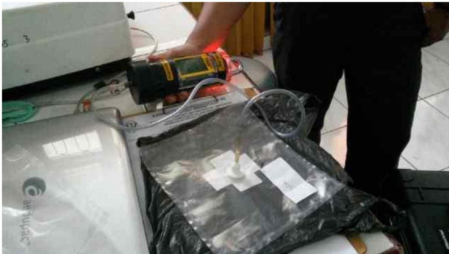
Gambar 7. Proses analisa gas menggunakan Gas Portable Detector