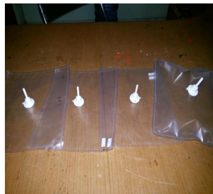
(b) Gas Sampling Bag