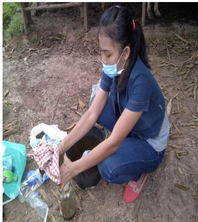
(a) Pemasaran Kotoran Sapi