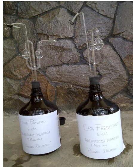
(b) Botol tempat pembibitan