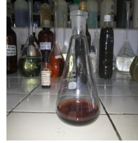
(e) hasil titrasi