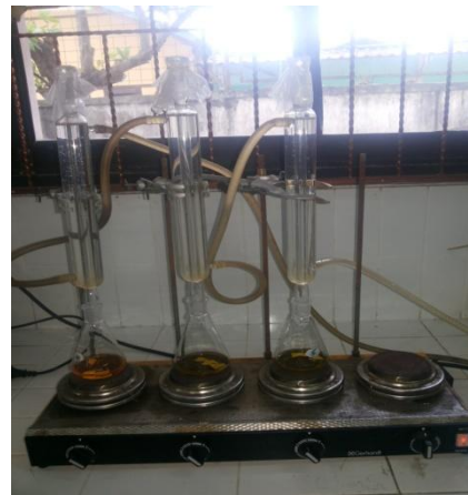
(b) Pemanasan sampel dan Blanko