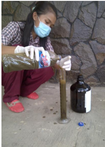
(a) Pencampuran Kotoran Sapi dan POME