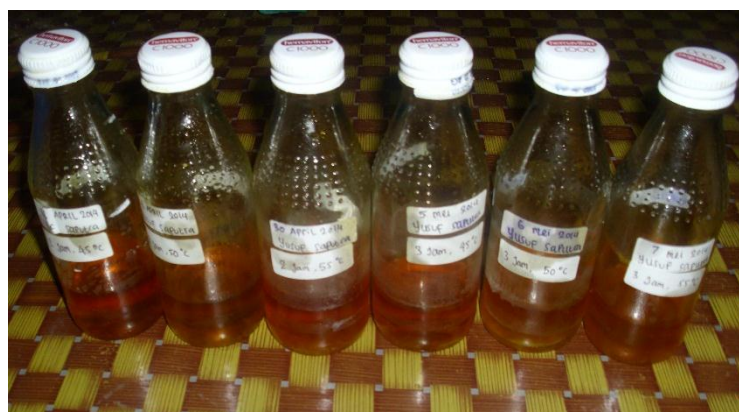
Produk Biodiesel dari Limbah padat kelapa sawit