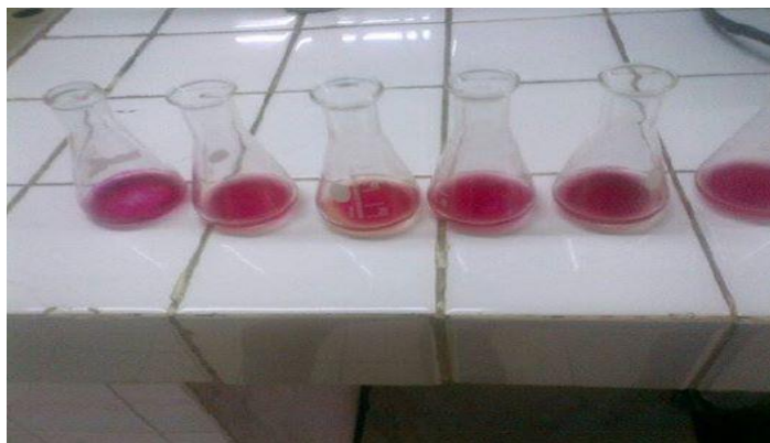
Hasil Titrasi Saat Analisa Bilangan Asam