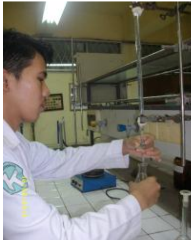
Saat Melakukan analisis bilangan Asam