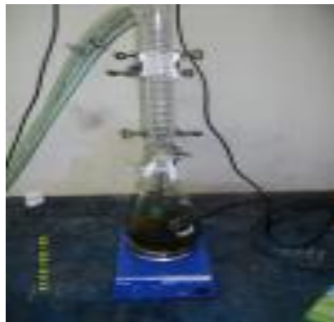
Proses Transesterifikasi In Situ