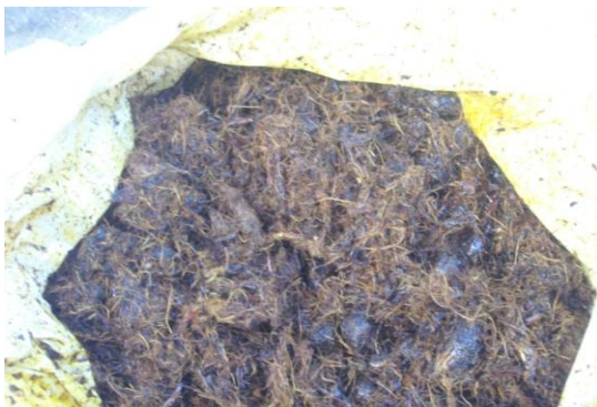
Limbah Padat Kelapa Sawit