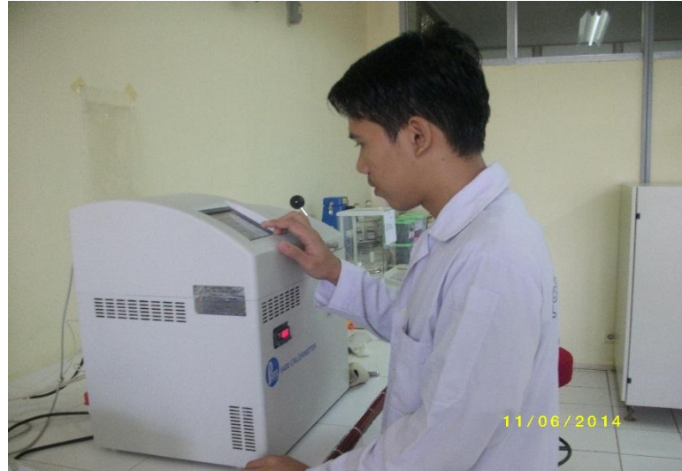
Analisa Nilai Kalor