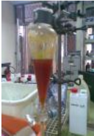
Proses Pemisahan Antara Gliserol dan Biodiesel