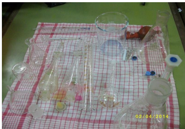
Peralatan pendukung proses