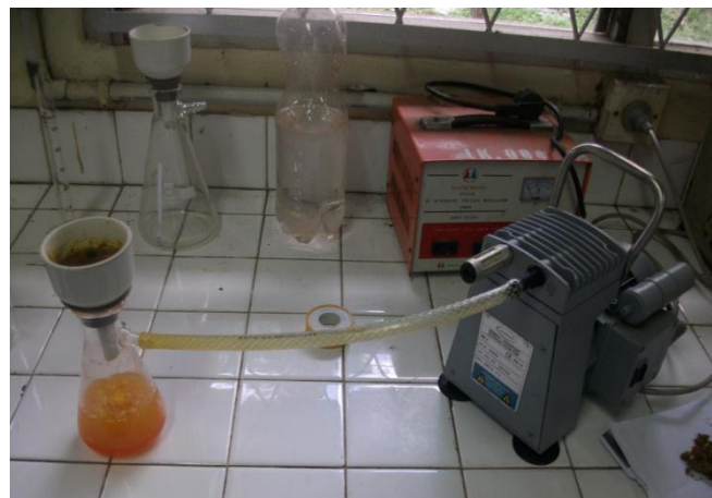
Penyaringan dengan pompa Vakum