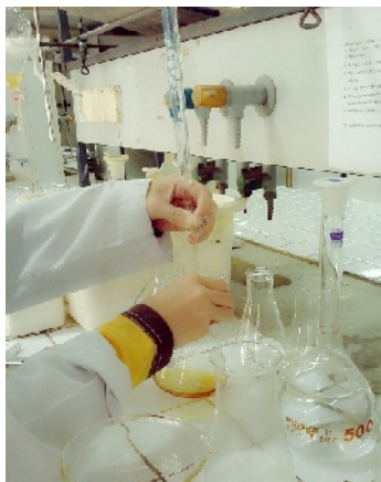
Proses Titrasi Iodine