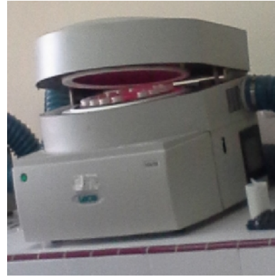
Proses Analisis Proksimat