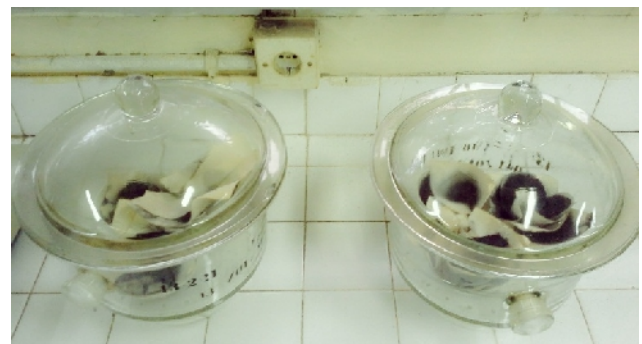
Pendinginan dalam desikator