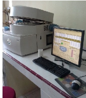
Seperangkat Alat TGA-701