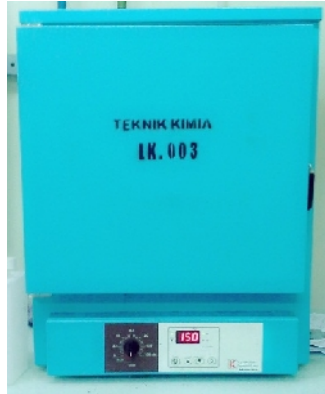
Oven Gemmyco Digital