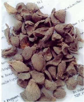
Cangkang Kelapa Sawit