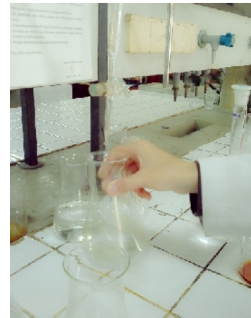
Proses Titrasi Selesai