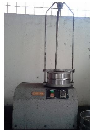
Sieve Shaker (ASTM)