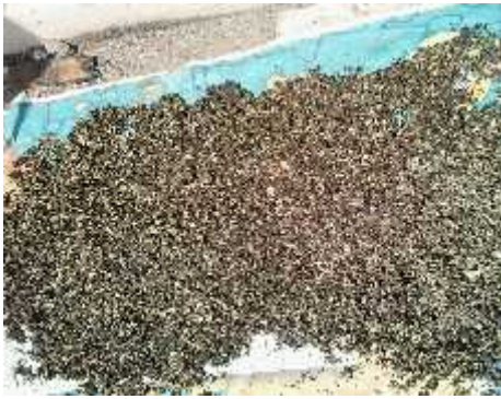
Saat penjemuran karet butiran