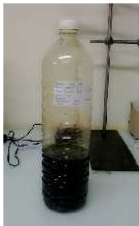
Didapat hasil perengkahan