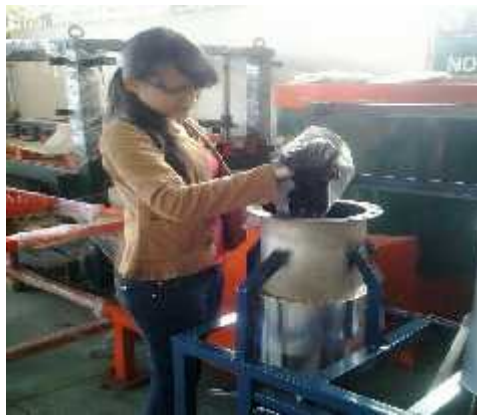
Dilakukan proses perengkahan